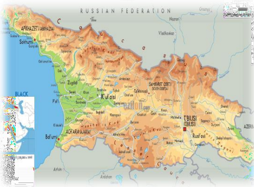
Carte du Pays